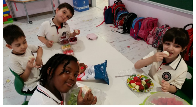
Sevdiğimiz meyveleri getirerek meyve partisi yap-