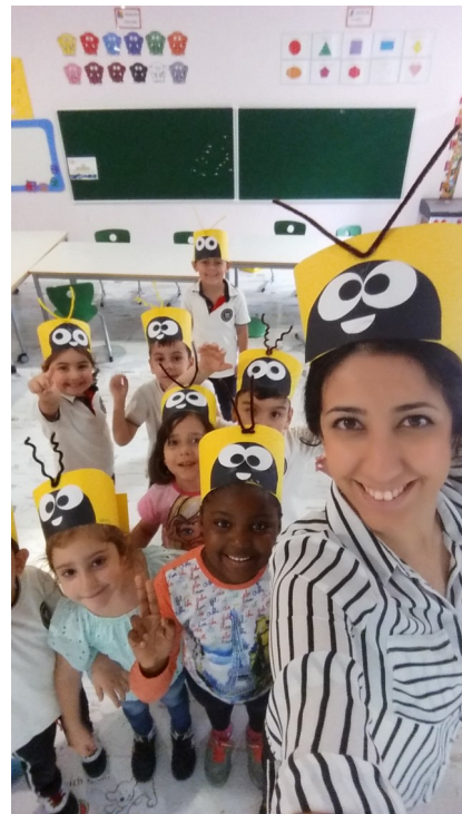
Gems Arılar konusunda arı olup çiçeklerden polen topladığımız polenleri de örüntü çalışması yaparak kullandık.